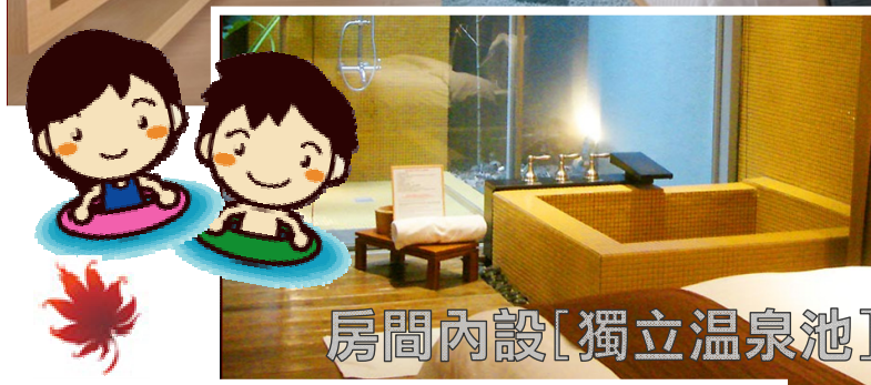
房間內設[獨立溫泉池]