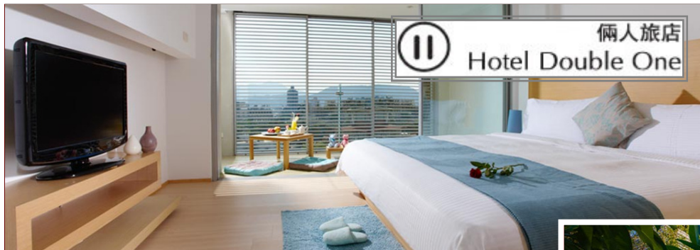
倆人旅店 Hotel Double One