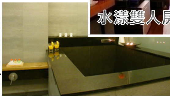
[獨立溫泉池] 包早餐